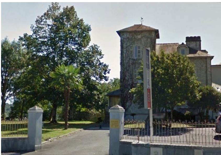
Дім родини Пелісьє тепер мерія Ідрона

Завдяки Берті Пелісьє Українська бібліотека імени Симона Петлюри володіє архівом неоціненної цінності, до якого часто звертаються дослідники з усього світу.