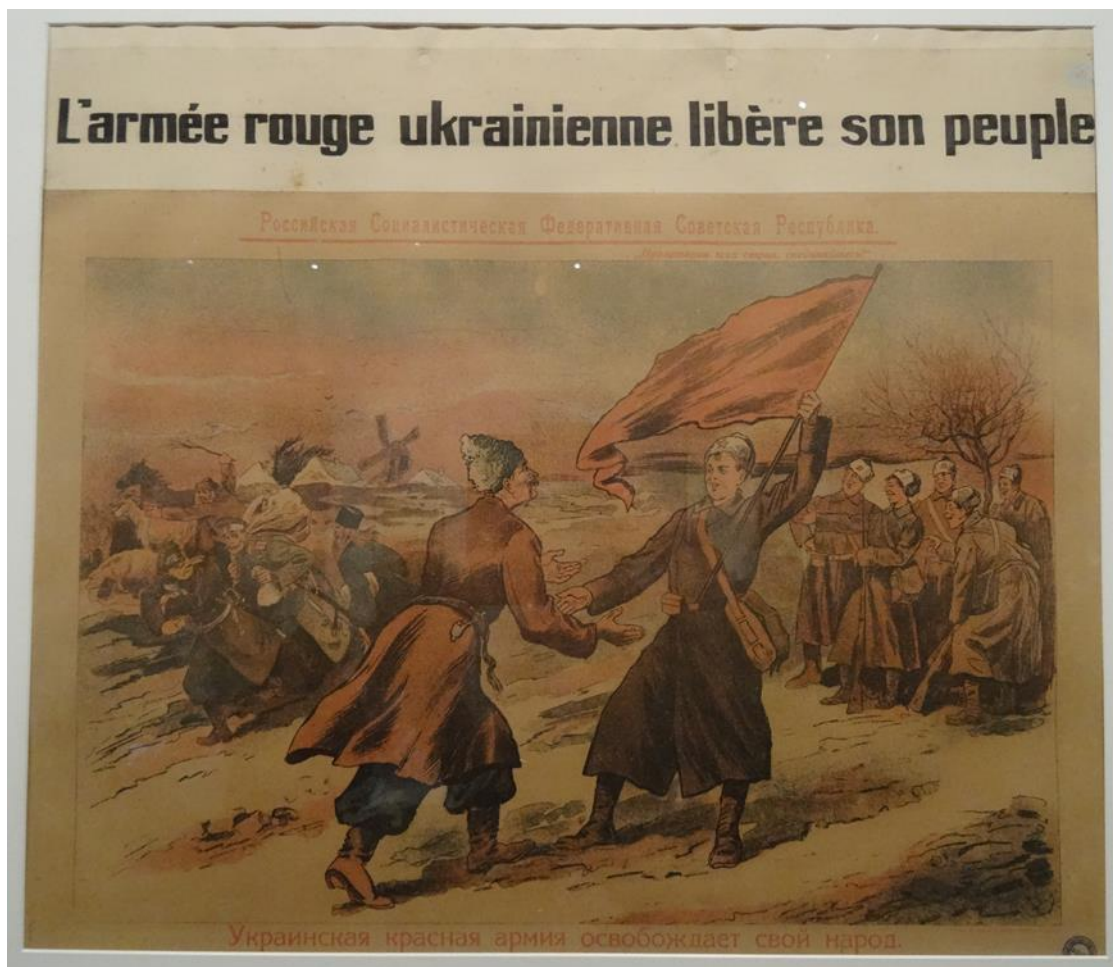
Анонім, плакат «Українська Червона Армія звільняє свій народ» 1919 р. (BDIC)