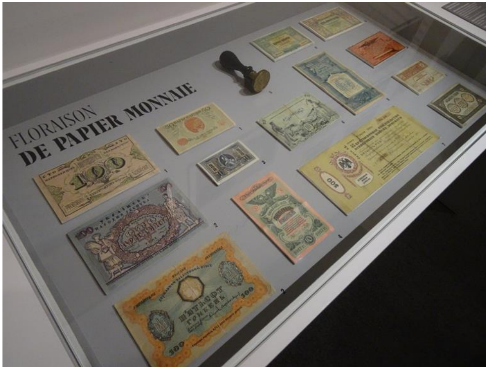
Представлено паперові гроші, випущені Національним банком Української Народної Республіки. Зліва зверху вниз: 100 та 50 карбованців (початок 1918 р.), номінальна вартість написана українською мовою, на звороті – російською, польською та ідиш, також банкноти 100 гривень (1918), 500 гривень (1918).